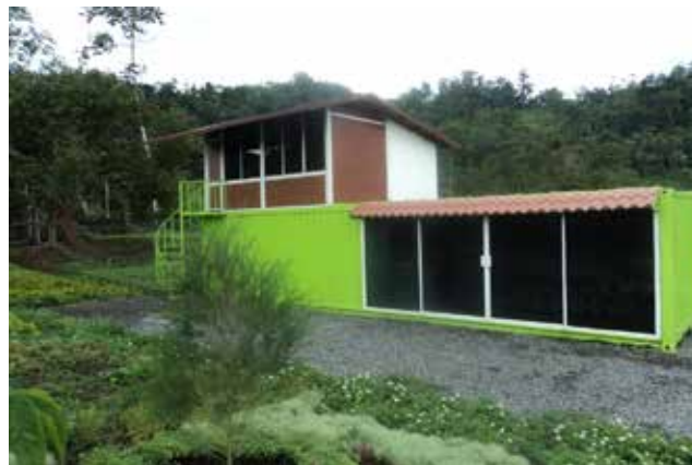
Oficinas del nuevo vivero

El vivero está ubicado en la comunidad de Jimbitono y tiene como propósito ejecutar proyectos de reforestación en Jimbitono, Proaño y Macas.