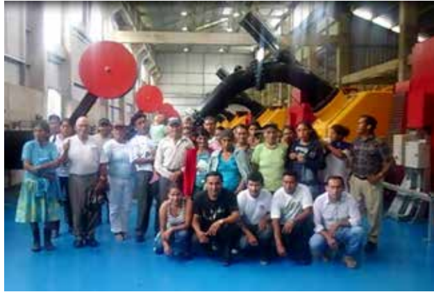
Comunidad de 9 de Octubre