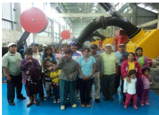
Comunidad de Zuñac